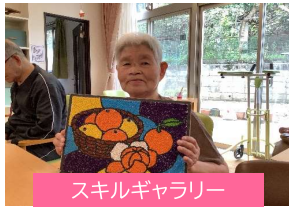
スキルギャラリー