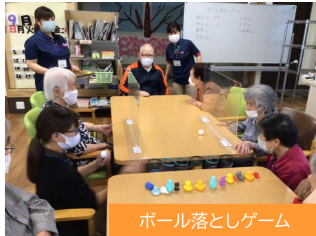
ボール落としゲーム