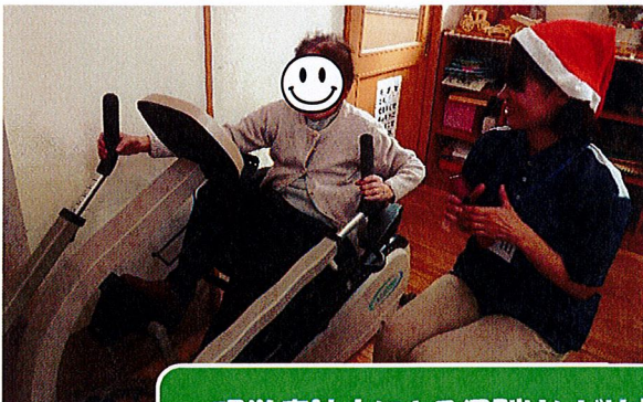
理学療法士による個別リハビリ中 自立支援・介護予防をサポートします。