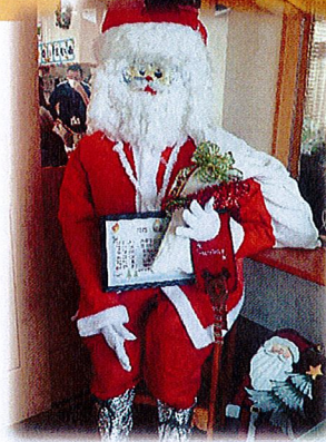
職員の手作り サンタクロース