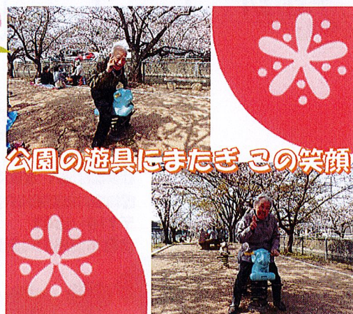
公園の遊具にまたぎこの笑顔!