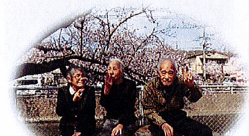
ユニークなポーズを取る方々...