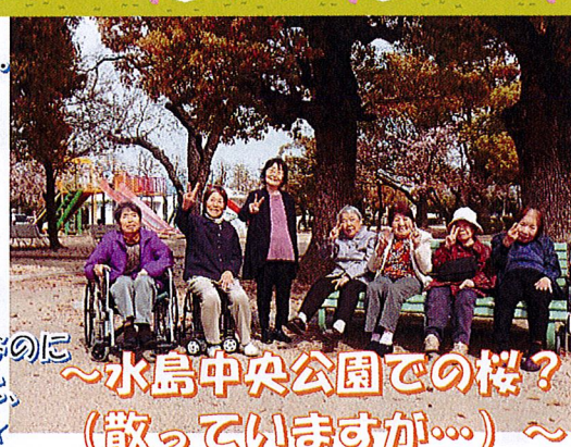
~水島中央公園での桜? (散っていますか...)~