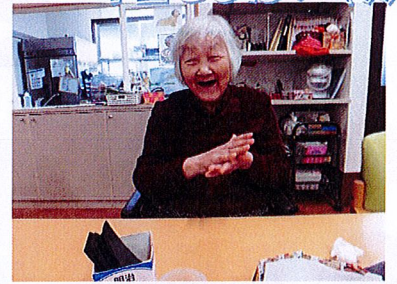
陽当たりの良い場所で