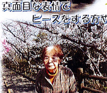
カメラを向けるまでは笑顔なのに「写真とりますよ」と言うと、真顔になる方、様々です☆