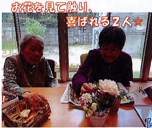
お花を見て触り、喜ばれる2人☆