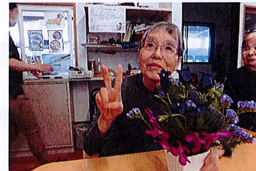
お花クラブに初めての参加！