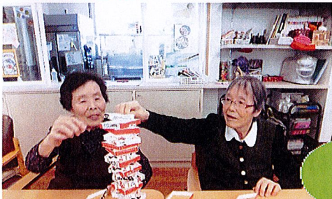
クラクラしているにも関わらず 迷うことなく積み重ねる...Σ(・ω・)/！！