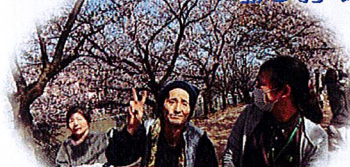
真面目な表情でピースをする方々...