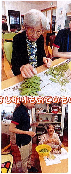
すじ取りもおてのもの！